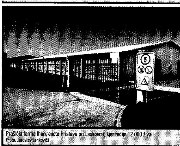
Prašičja farma Ihan, enota Pristava pri Leskovcu, kjer redijo 12.000 živali