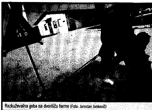
Razkuževalna goba na dvorišču farme

Lani je izbruhnila v bližini Vukovarja in v nekaj mesecih je virus prepotoval 500 kilometrov ter pred dnevi udaril v kraju Vučilčevo, pičlih 500 metrov od slovensko-hrvaške meje v občini Brežice. Ker je žarišče tako blizu Slovenije, 10-kilometrski ogroženi pas sega globoko na ozemlje naše države. Še več, k nam sega tudi t. i. trikilometrski okuženi pas, kar uradno pomeni, da je virus že prestopil mejo, čeprav veterinarji do tega trenutka niso za-