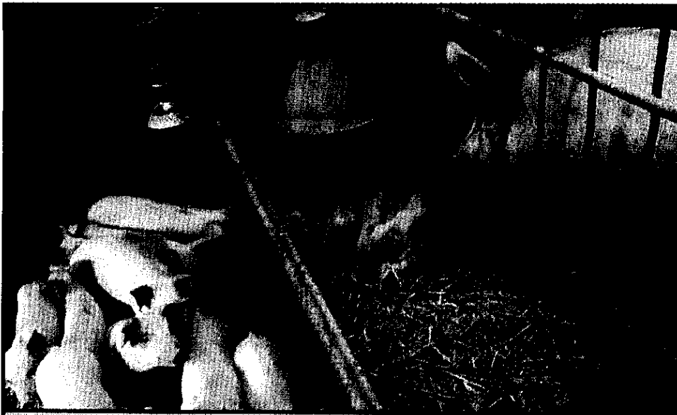
Upajmo, da jih ne bo pobralo.