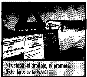
Ni vstopa, ni prodaje, ni prometa.

Slovenski veterinarji so samo lani iz slovenske črede prašičev vzeli 44.000 vzorcev krvi, da bi preverili, ali se morda kje skriva kakšen virus. Hrvati na drugi strani po Slavoniji še vedno izvajajo ekstenzivno pašno rejo, pri čemer je velika nevarnost, da domači prašiči pridejo v stik z divjimi svinjami. Nekateri namigujejo, da se je virus na Hrvaškem razširil prav zaradi tega.